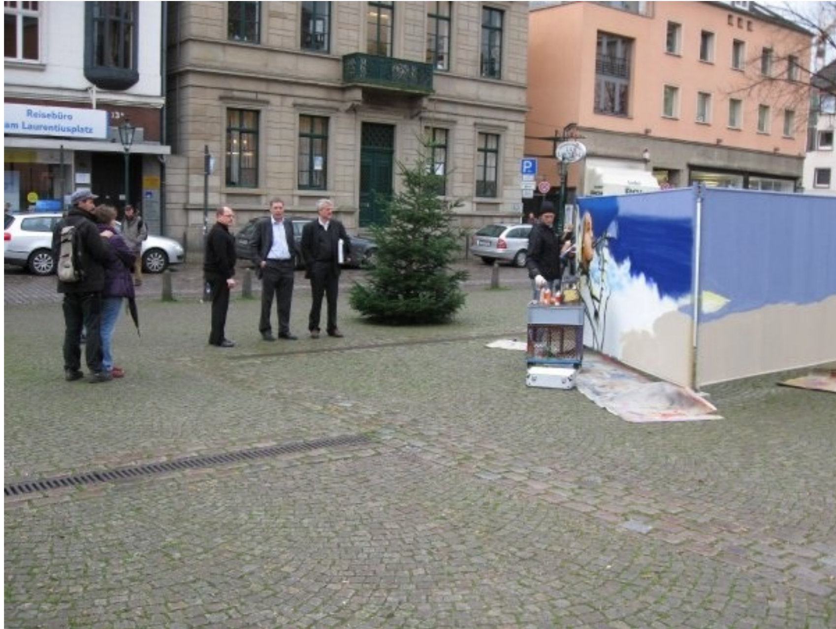
Die Wuppertaler Graffiti-Krippe