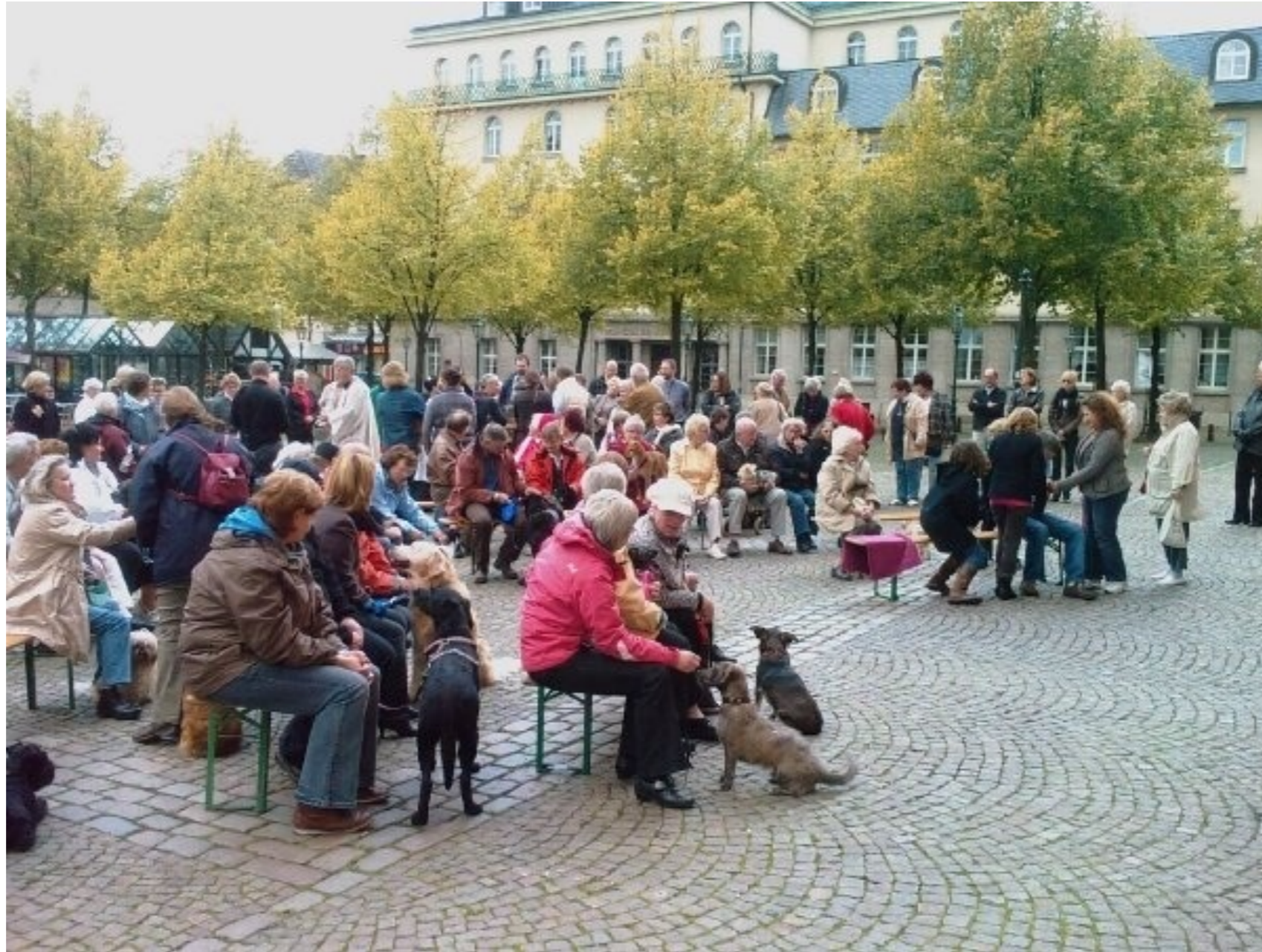
Die Wuppertaler Tiersegnung am 4. Oktober