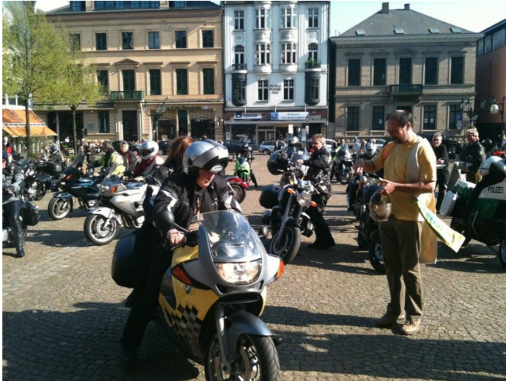
Die Wuppertaler Motorradsegnung im Frühjahr