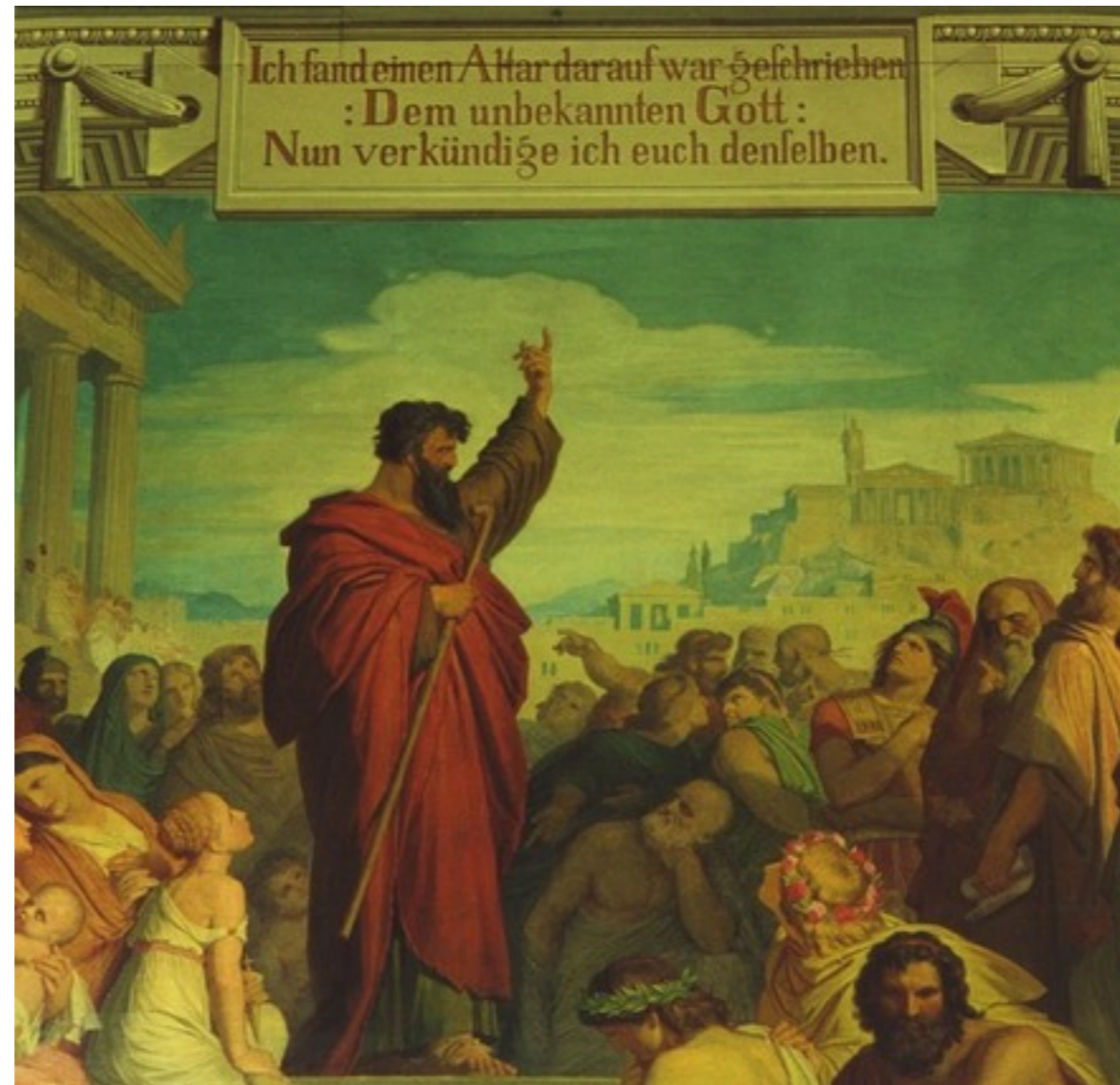
Paulus auf dem Areopag

Aus unmittelbarem Anlass im Gespräch mit der Welt