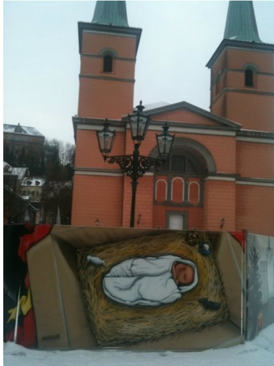
Die Wuppertaler Graffiti-Krippe